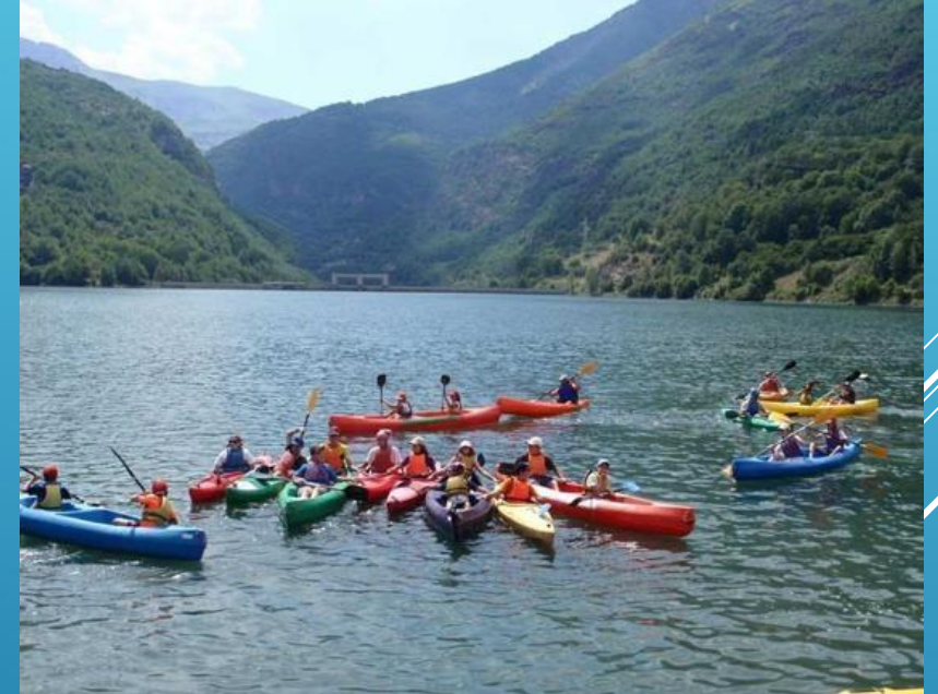
PIRAGUAS EN EMBALSE